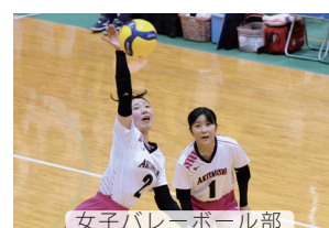
女子バレーボール部