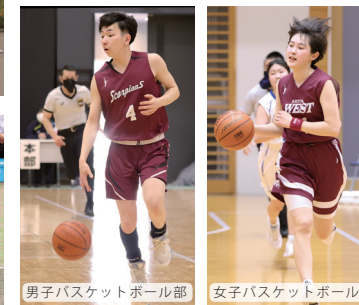
男子バスケットボール部