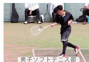
男子ソフトテニス部