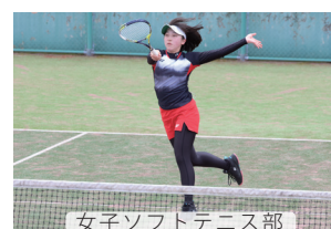
女子ソフトテニス部